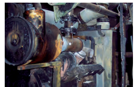
Bild 5 | Havarierter Fermenter mit ausgelaufenem Substrat einer BGA