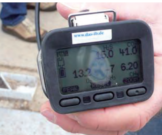
Bild 2 | Messung der Luft in einer Vorgrube – es ist ein explosionsfähiges Gasgemisch vorhanden