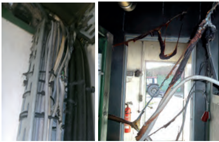
Bild 7 | Brandschäden in BHKW-Räumen als Folge von Leitungsbränden

Konstant – jedoch auf relativ niedrigem Niveau – sind Schäden durch Brände aufgrund von falschen (nicht normgerechten) Ausführungen von Elektroinstallationen (d. h. keine fachgerechten Ausführungen):