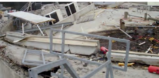
Bild 4 | Folgen einer Explosion in einem geschlossenen Gebäude einer BGA

Es waren und sind Schadenauffälligkeiten bei Zündstrahlmotoren (Verbau von eigenen preiswerten Einspritzdüsen, Ölleckagen/Öllappen) und allgemein Motoren zu finden, da die Abstände zu brennbaren Materialien (Holzkonstruktionen am Dach oder Boden) nicht eingehalten worden sind (Bild 6).